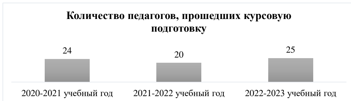
Диаграмма 3. Количество учителей, прошедших курсовую подготовку за 3 года.

Для повышения уровня профессиональной деятельности учителя принимали участие в семинарах, конференциях, педагогических марафонах, круглых столах, публиковали свои разработки на различных сайтах.